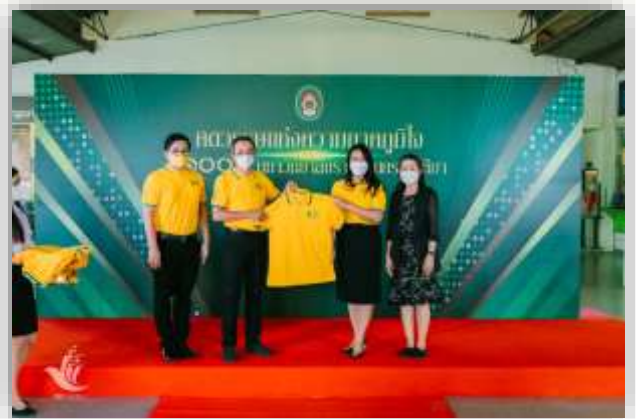
ภาพข่าวจากงานประชาสัมพันธ์